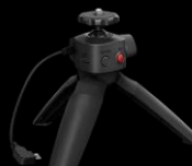
Poignée - Trépied DMW-SHGRIE EAN: 5025232940714