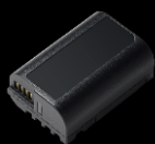
Batterie additionnelle DMW-BLK22E EAN: 5025232940189