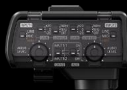
Module XLR DMW-XLR1E EAN: 5025232857364